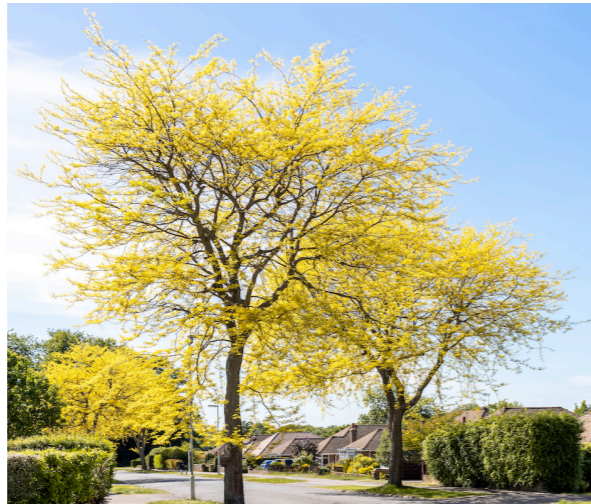
gleditsia - ca 15 hoog, brede kronen raken elkaar