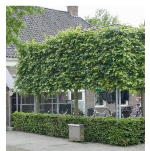
leiboom (bv beuk) - maximaal 3 hoog