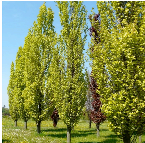
zuil beuk ca 20 hoog, op voldoende afstand van elkaar planten (min 6 meter)