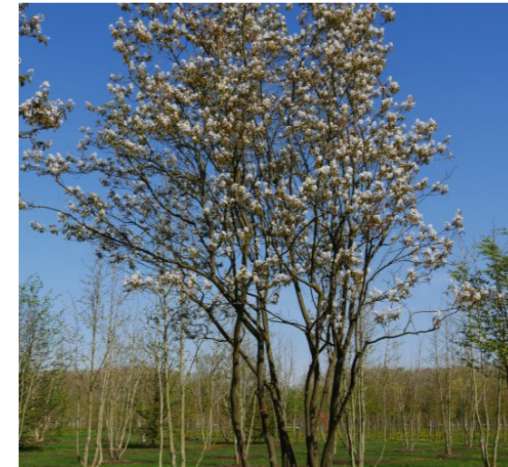
meerstammig krentenboompje - max 6 hoog