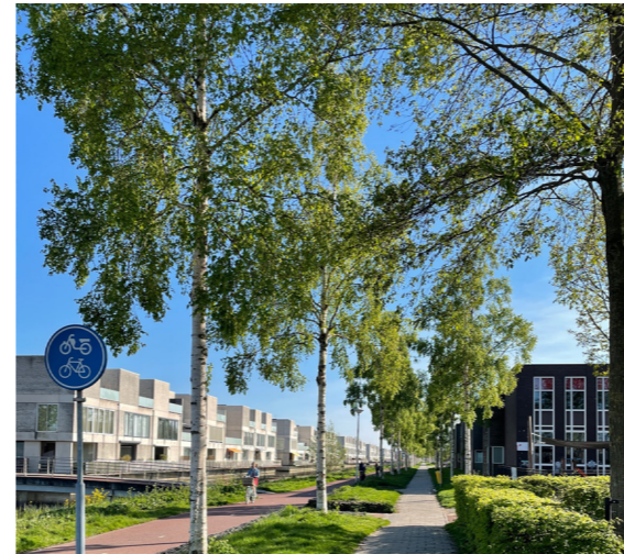
berk - ca 15 hoog kunnen vrij dicht op elkaar (3 meter)